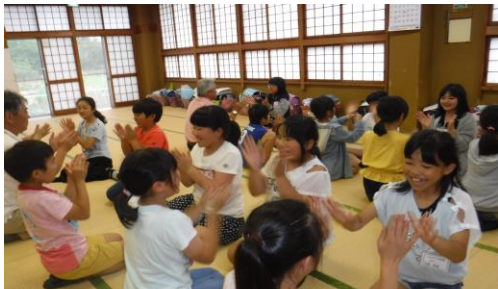
〔友達とボランティアさんと仲良くなるために。みんな笑顔。よろしくね。〕