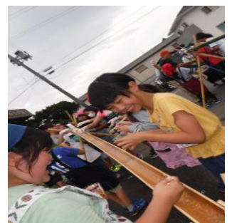
〔竹を割ると節を通る度にパンパン花火のような音がしました。みんなで準備した流しそうめん〕