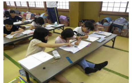
〔宿題。教え合う姿もみられて〕