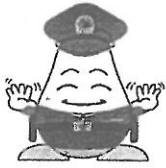
福島県警察シンボルマスコット 福ぼうしくん