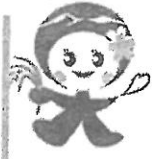
大玉村観光キャラクター たまちゃん