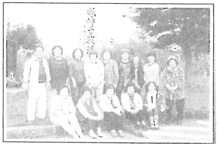
【桐山サロン(15区)で母成峠ヘッドライブ】27年9月実施