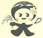
大玉村観光キャラクター 「たまちゃん」