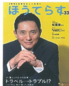
第33号「トラベル→トラブル!？」