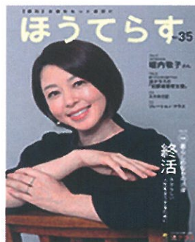
第35号「自分らしい人生を全うするために」

☆広報誌「季刊 ほうてらす」WEBサイト http://www.houterasu.or.jp/ からご覧いただくことができます。