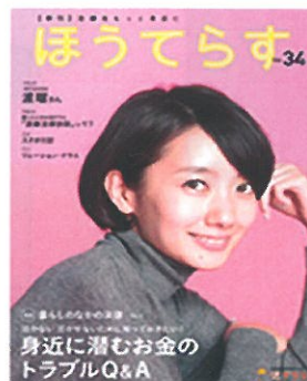
第34号「身近に潜むお金のトラブルQ&A」