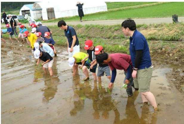
←いよいよ田植え体験の開始！→