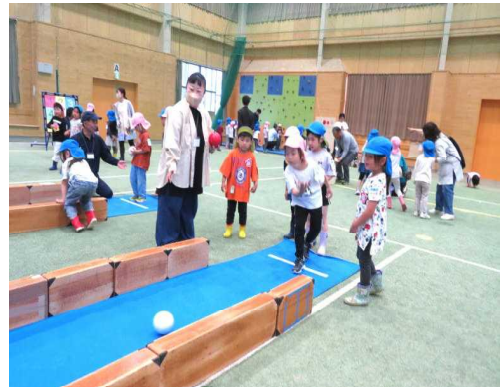
ビーンボーリング

その他に、ディスクゴルフ、ラダーゲッターのコーナーもありました。みんな目を輝かせて夢中になって挑戦していて、笑顔がとっっても眩しかったです!