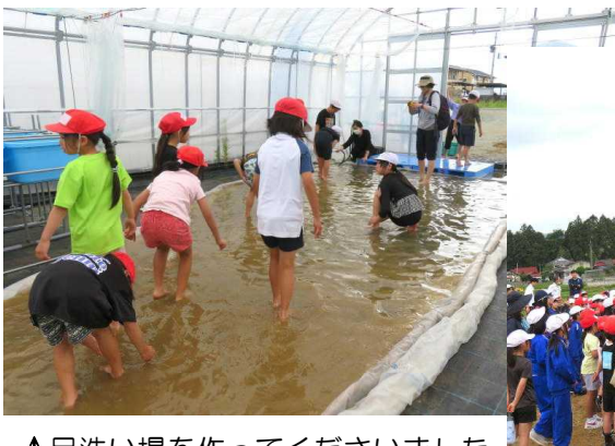
↑足洗い場を作ってくださいました