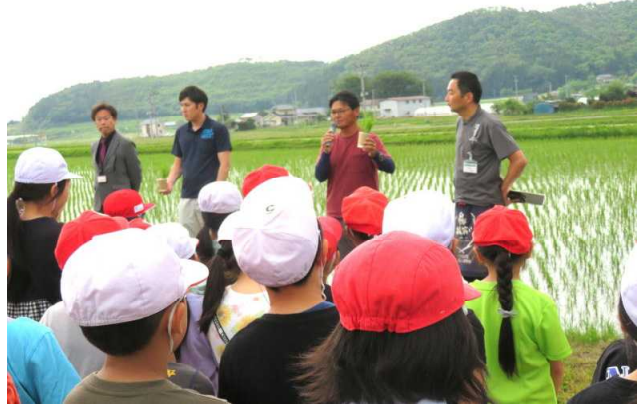
↑田植えまでの農家の仕事についてお聞きしました