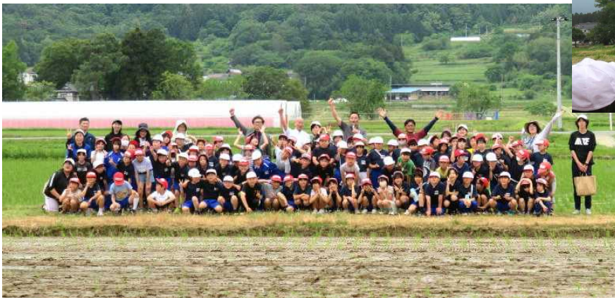
←最後にみんなで記念撮影をしました。子どもたちからは「うまかった！」「もっとやりたい！」の声が多数あがりました。