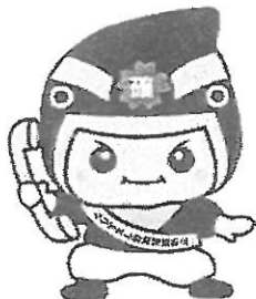
なりすまし詐欺被害防止広報用マスコットキャラクター 「カクニンジャー福くん」