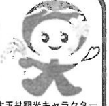
大玉村観光キャラクター 「たまちゃん」