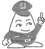
福島県警察シンボルマスコット 「福ぼうしくん」