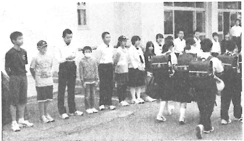
明るく、「おはようございまーす！」大玉中にて

おおたま学園では、児童会・生徒会交流活動を行っています。その一つとして、今回「あいさつ日本一の学校」をめざして積極的に活動している大玉中学校の先輩たちと一緒に、児童会の代表が大玉中学校で「あいさつ運動」を行いました。「おはようございます！」と明るく響くあいさつはとても気持ちが良いものです。本校でも中学校に負けずにあいさつを行ってきたいです。9月には、中学生が小学校に来てまた一緒に活動する予定です。(2016/06/15)