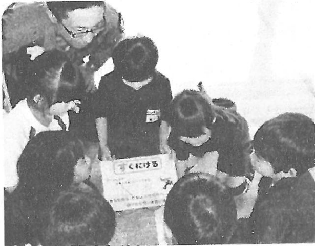
危険にあわないキーワード「い か の お す し」(低学年)

教員免許を持たなくても、優れた知識や技術を持った社会人の方を積極的に学校現場で活用していくために設けられた制度です。本校では、ここ十年ほど毎年水泳指導で活用させてもらっています。