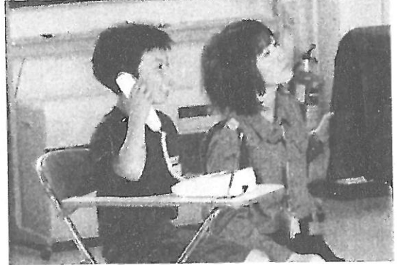
留守番時の不審電話への対応の仕方(中学年)