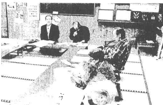
【かみごとサロン(1区)で社協会長による話】28年9月実施