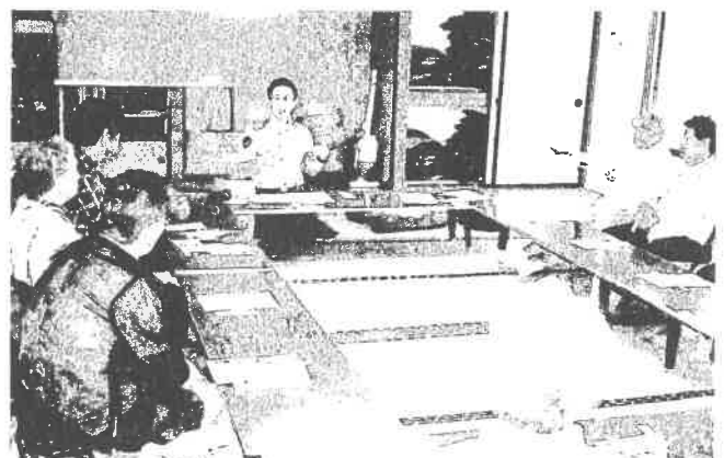
【久寿サロン(9.10区)で駐在さんの講話】28年9月実施