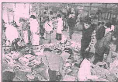
毎年大盛況のバザー