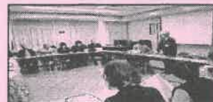
【27年度サロン代表者会議の様子】

サロン代表者の方以外にも、今後サロンを立ち上げたい、サロン活動に興味があるという方の参加も可能です。