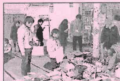
バザーで販売の手伝い中