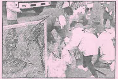
集めたゴミを分別中

この他に、国際アート&デザイン専門学校の学生ボランティアによる似顔絵コーナーやバザー、各売店も賑わっていました。今回のボランティアフェスティバルも多くの方にご来場いただき、障がいのある人もない人も、世代を超えて楽しめたフェスティバルになったと感じました。