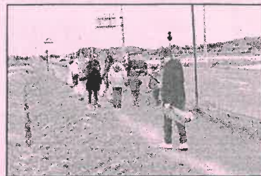
田んぼ通り清掃中

これからも美しい村、住みよい村に、一人一人が心がけ地域とともに助け合い水も空気もきれいな豊かな自然を守りましょう。