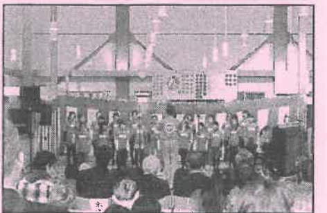
心に響く大山小学校合唱部