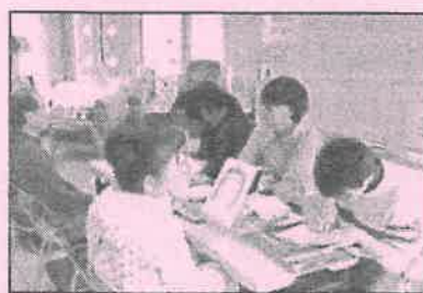
大好評の似顔絵コーナー