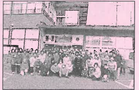
清掃終了後、役場前で集合写真