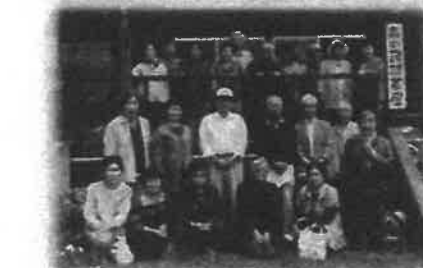
13区 ホットふれあいサロン 6月 森の民話茶屋見学