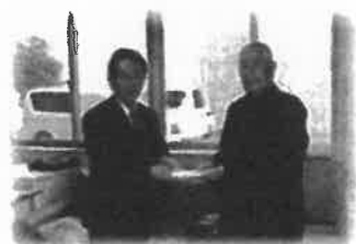
大玉村老人クラブ連合会 様

その募金を大玉村に住む下記の方々に温かい年末を過ごしてもらう為大玉村民生児童委員協議会の御協力で配分しました。残りは来年度のサロン活動等に活用します。