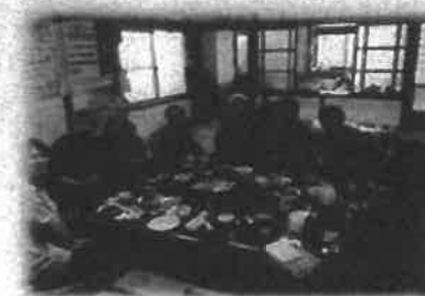
9区、10区 久寿サロン 10月 おやつ作り