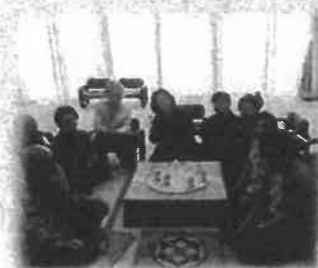
8区 玉八サロン 6月 湯治会

現在19ヶ所でサロン活動が実施されています。どの地域のサロンも、月に1回楽しい時間を過ごしています。外出のきっかけや、友達作り、ちょっとした息抜きに是非地域のサロンへ参加してみてください。