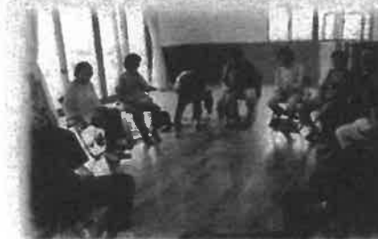
11区 TOBUサロン 9月 健康体操