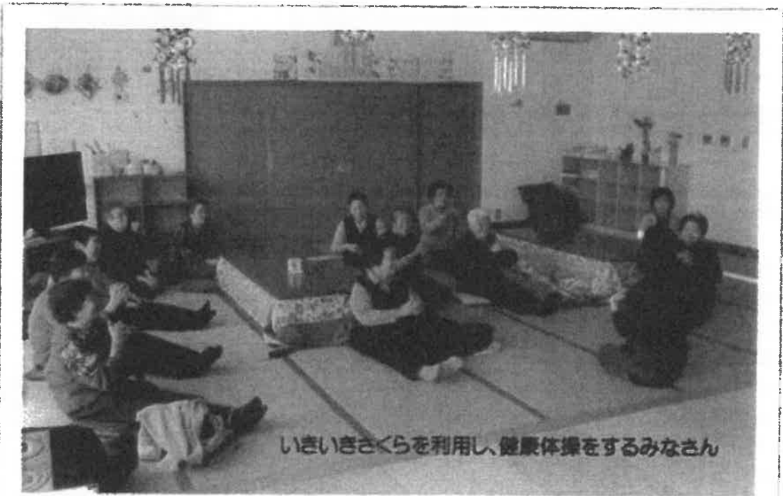
いきいきさくらを利用し、健康体操をするみなさん