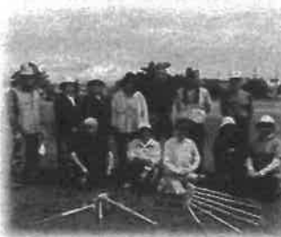
12区 遊遊サロン 6月 グラウンドゴルフ