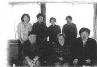
12区 長寿サロン 11月 健康づくり講話