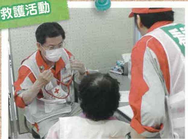
災害時には医療救護班を派遣します。日頃から災害に備えた訓練や研修、資器材の整備を行っています。