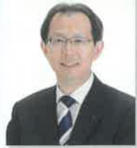
日本赤十字社福島県支部 支部長 内堀 雅雄

県民の皆さまには、日頃より日本赤十字社の活動に対し、温かいご支援を賜り心から感謝申し上げます。 東日本大震災及び原発事故から丸6年が経過し、県内では復興に向けた動きが活発になってきてはいるものの、今もなお、8万人近くの県民が県内外での避難生活を余儀なくされるなど、本県の復興はいまだ途上にあります。 日本赤十字社福島県支部は、昨年4月の熊本地震において、発生直後から医療救護班やこころのケアチームを派遣し、避難所等で医療救護・支援活動を展開いたしました。 このような赤十字の事業・活動は県民の皆さまからの善意の支援金等により行っています。 今後も「人間のいのちと健康、尊厳を守る」という日本赤十字社の使命を果たすため、従来からの災害救護活動や国際救援、医療事業、血液事業等に加え、急速に進む高齢化を踏まえた高齢者支援活動や地域の防災力向上に向けた取り組みも積極的に展開してまいりますので、県民の皆さまには日本赤十字社の活動資金について格別のご理解とご協力をお願い申し上げます。