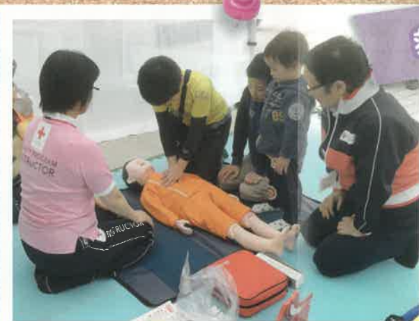
いのちと健康を守る講習会の普及。