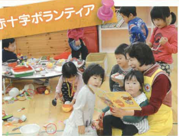
赤十字ボランティアは地域の福祉ニーズに対応した活動をしています。