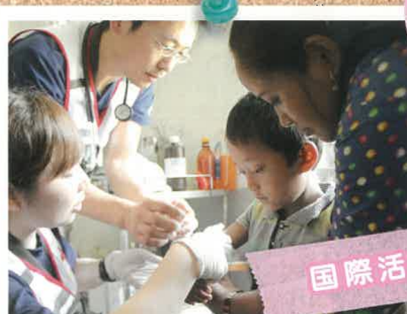
災害や紛争の発生した地域で、赤十字のネットワークを活かし、包括的な活動に取り組みます。