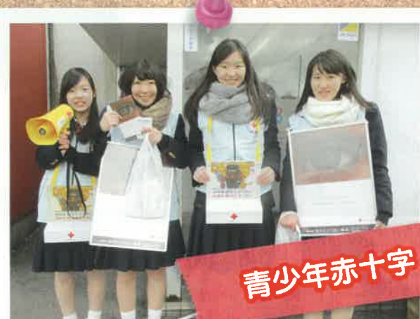
児童生徒も世界の平和と福祉に貢献するよう活動をしています。