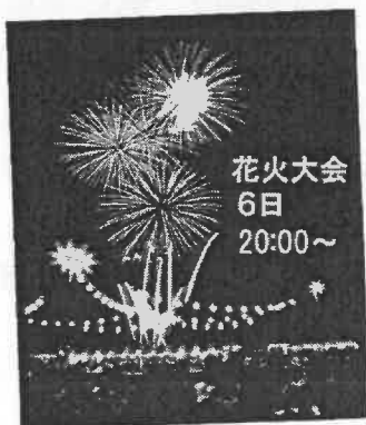
花火大会 6日 20:00~