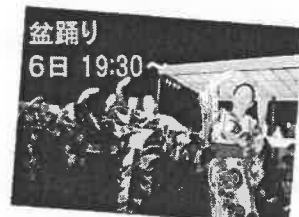
盆踊り 6日 19:30