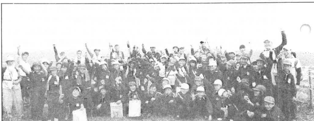
平成 28 年度実施の「大名倉山登山」。大山・玉井小 3 年生がみんなで力を合わせて登頂しました。