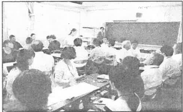
玉井幼稚園・玉井小学校の学校運営協議会。協議の内容や進め方は各学校に一任し、より各学校園の課題に寄り添った話し合いができるようになりました。