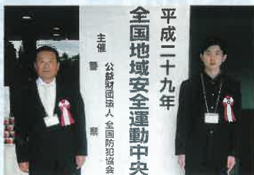
(左から) 圓谷氏、本田氏