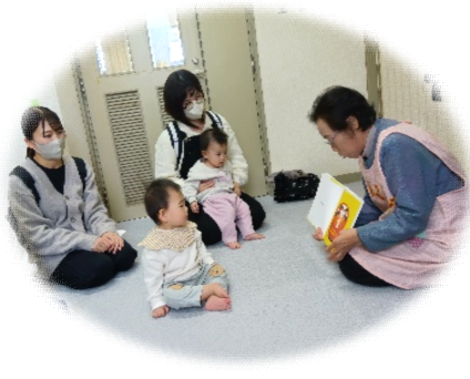
10か月健診ブックスタート ＜絵本の読み聞かせ＞