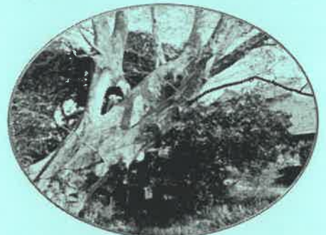
織井の清水の大ケヤキ 玉井南町

山や海・孤島、森や 大木・滝、洞窟や岩 陰・巨岩、太陽や月、 神や仏、堂宇、鉦・ 鐘や太鼓・