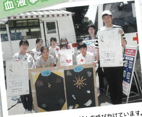
尊い生命を救うため街頭で献血を呼びかけています。