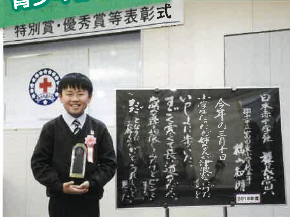
児童・生徒も世界の平和と福祉に貢献できるように赤十字を学んでいます。