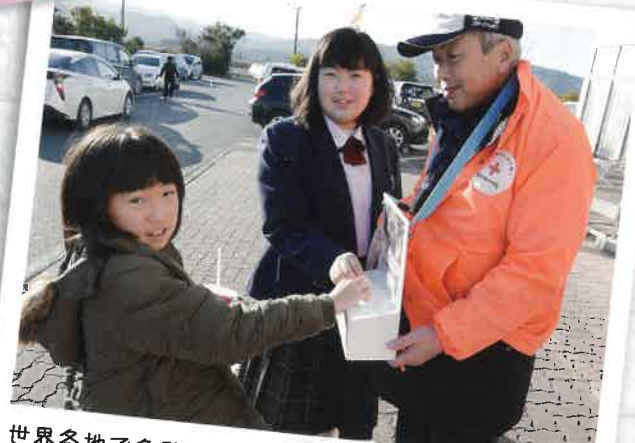
世界各地で多発する紛争の犠牲者や自然災害等による被災者への救援活動実施のため募金をしています。