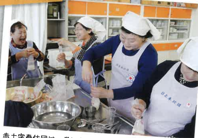
赤十字奉仕団は、常に災害に備え被災された方々への炊き出し等訓練を行っています。