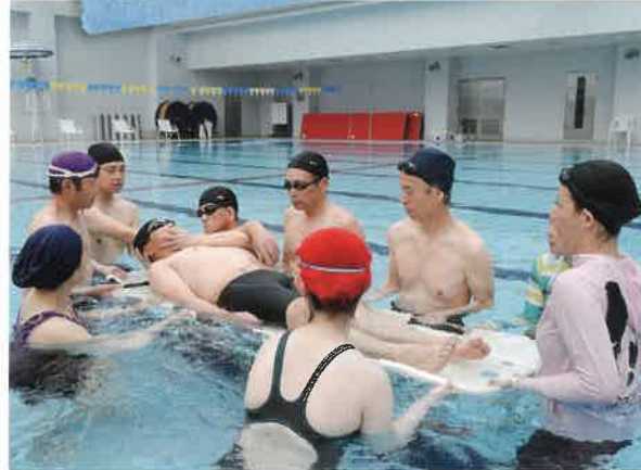
赤十字救急法や健康生活支援講習、幼児安全法講習など命と健康を守る講習会を開催しています。