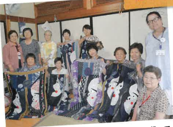
赤十字ボランティアが様々な復興支援活動を行っています。