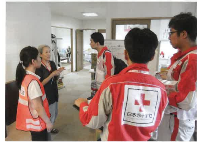
北海道胆振東部地震救護班第一班の活動