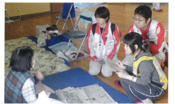
北海道胆振東部地震救護班第二班の活動