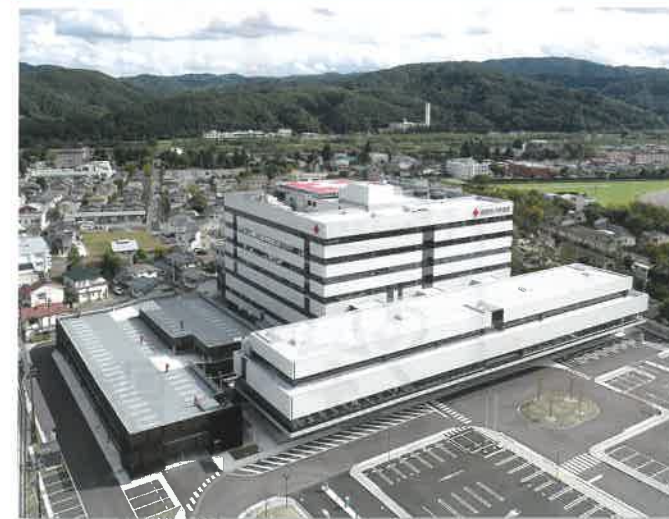
新病院(平成30年10月13日撮影)