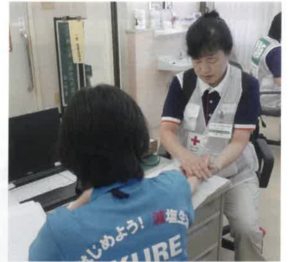
西日本豪雨災害こころのケア班の活動