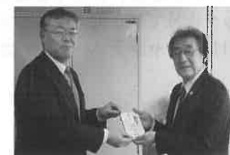
二本松安達地区労働福祉協議会 様