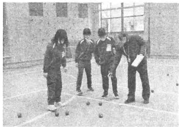
ペタンク…目標（ビュット）を注意深くねらって投げました。どちらが近いのか、判定は？