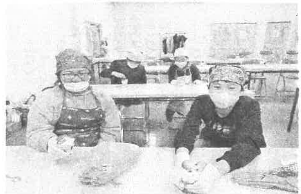
グラスケーキ作り…同じ材料でも、個性あふれたケーキが完成しました。