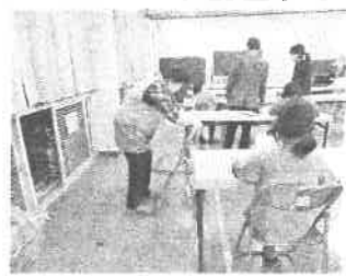
活動後の消毒活動

3学期の子ども教室は、玉井教室は1月15日（金）、大山教室は1月18日（月）からの開始となります。よろしくお願いいたします。