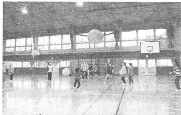
風船バレー…大きな風船が思うように動きませんが、そんなこともとてもおもしろくて、みんなで楽しく活動できました。