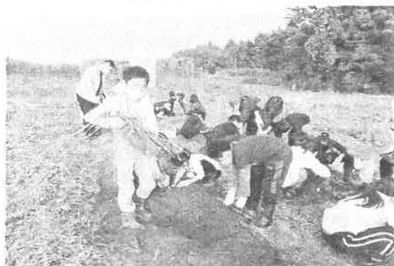
さつまいも掘り…びっくりするほどの大豊作でした！（おみやげもたくさん…）