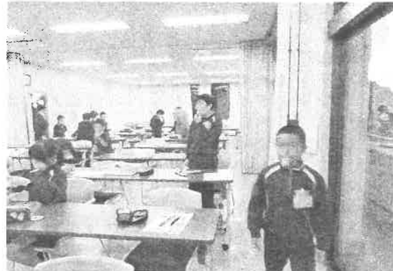
牛乳パックホイッスル…自分で作った笛でいい音を出していました。（楽しそう！）