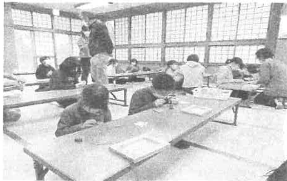
木工作品作り…木枠や来年の干支の牛などの製作をしました。