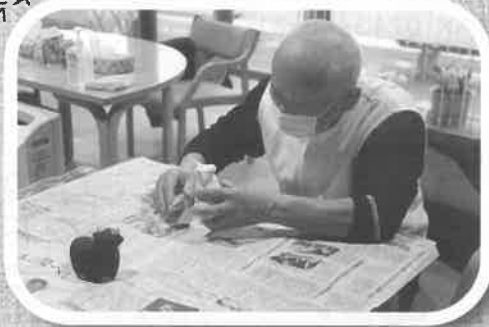
今年の干支「牛」の置物を製作中

大玉村社会福祉協議会では、高齢者生きがい活動支援通所事業とし、「いきいきさくら」(介護予防を目的とした通所事業)を開設しています。自宅前からの送迎、昼食、入浴などのサービスがあり、村内にお住いの65歳以上の元気な方(介護保険に該当していない方)であれば誰でも利用することが可能です。詳しい内容については、お問い合わせください。