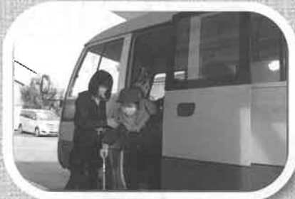
自宅前からバスで送迎、美味しい昼食

問合せ:大玉村社会福祉協議会 総合福祉センターさくらTel.0243-68-2100 (平日9:00~17:00)