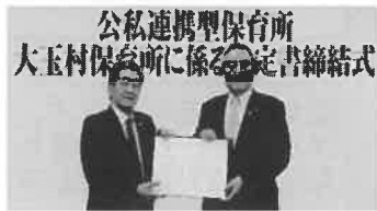
R2.11.26 大玉村長と当協議会長による協定締結式

大玉村社会福祉協議会では、村との調整・検討を進め、9月には運営候補者の指定がなされ、当協議会の理事会・評議員会の決議を経て、11月26日に公私連携型保育所大玉村保育所の運営等に係る協定書を締結いたしました。（右写真参照）