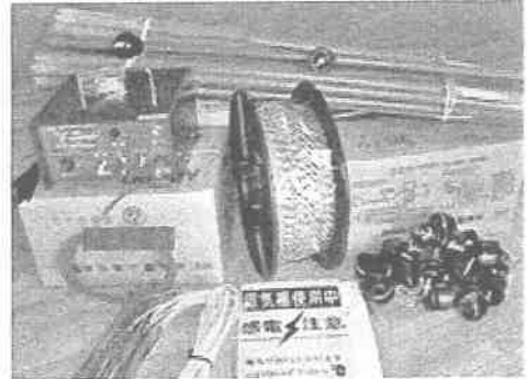
電気柵資材の提供をします