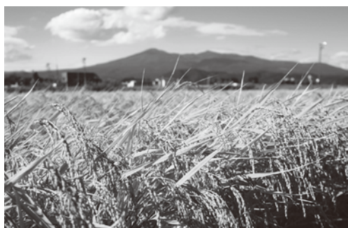
ブランド化を目指す大玉産米

安達地域合同就職相談会や新規就農者募集イベント等を通して、新規就農者確保に努めている。地域計画の説明