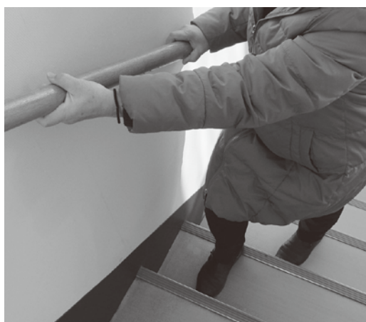
エレベーターの設置を望む