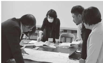
二本松土木事務所 (10月8日)

地域ボランティアの協力による「うつくしまの道・サポート制度」を活用して道路の除草や清掃を実施していますが、作業が追い付かない状況にあります。