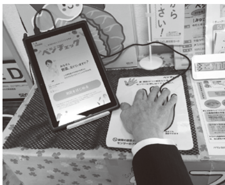
野菜の摂取量を確認して食生活改善を

寿推進村民会議で協議し、介護や認知症の予防を含めて総合的に事業を進めていきたい。