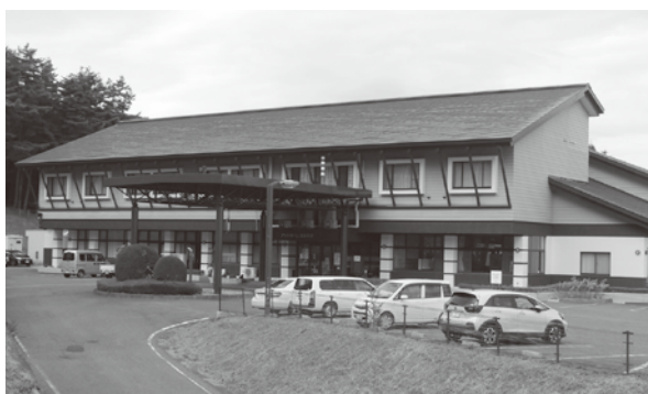
多くの利用が期待されるアットホームおおたま