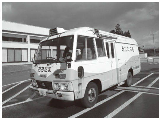
更新を待つ移動図書館車

独立した図書館は厳しいと感じている。これから建設を予定している子育て支援センターの書架を大きくし、図書スペースをしっかりと作っていきたい。