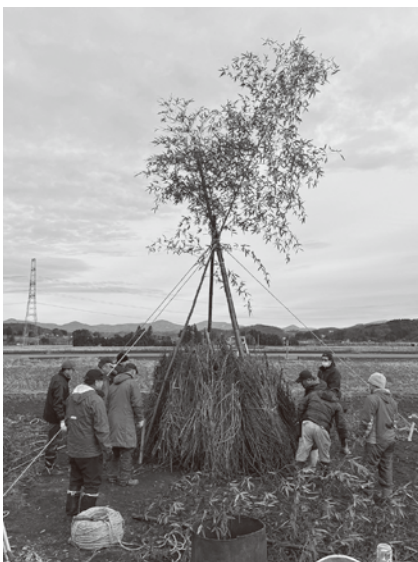
地域の絆を深める伝統行事

産業建設部長 アパートは入居者の出入りが多く、管理者に組づくりまで指導するのは難しい。管理者や事業者が経費増加を理由にごみステーションを設置