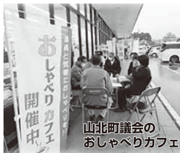
山北町議会の おしゃべりカフェ

う「おしゃべりカフェ」のほか、各種団体への出張カフェを開催しています。カフェで出された意見は、ホームページや議会だよりに掲載し、議会から町に提言をしています。