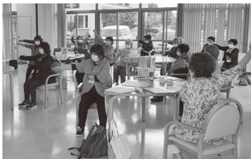
いろいろな事業に参加して介護予防を

住民福祉部長 地域のサロンや元気づくり体操、頭と体の健康倶楽部などがある。 武田 事業の効果を具体的に把握できているのか。また、期間を限って開催している事業もあるが年間を通して展開できないか。