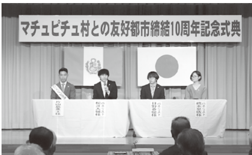
マチュピチュ村との友好都市締結10周年記念式典（11月22日）

村長 マチュピチュ村長から子どもたちの相互交流の提案があった。Zoomなどを活用し、子どもたちの交流を進めていきたい。関係機関の補助金などの財源の確保に努め、子どもたちの派遣を検討していきたい。