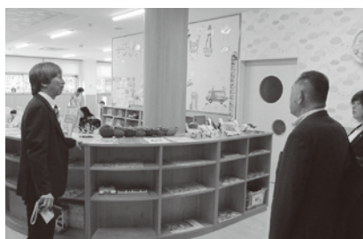
子育て支援センター (10月17日)

平成29年3月にオープンした施設で、子育て支援センター、多世代が交流できるスペース、地域産品直売所の3つの機能を備えています。