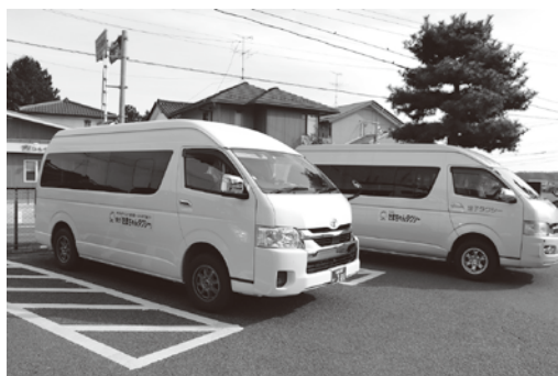
A | 予約が導入されたデマンドタクシー