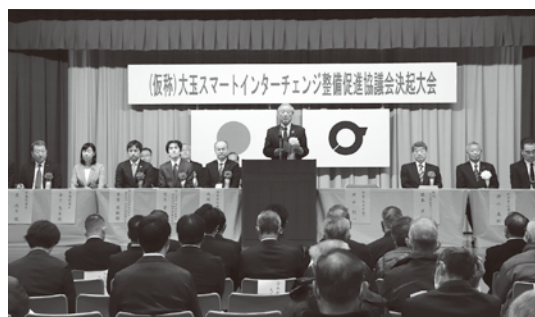
(仮称)大玉スマートインターチェンジ整備促進協議会決起大会 (12月21日)

これに併せて、都市計画マスタープランの関連で立地適正化計画を2年かけて策定してきた。この計画により財源の見通しがついたので、かねてより計画していた子育て支援センターの設計業務や事業化に着手していきたい。また、交流人口の拡大や農業振興、観光農業の推進は、直売所