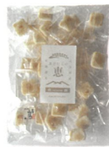
「あだたらの恵」 せんべい