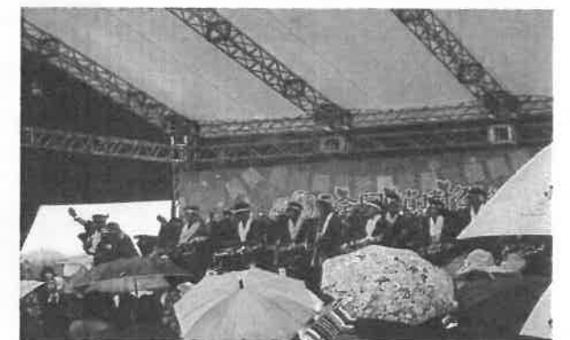
本揃田植え踊り（玉井小）