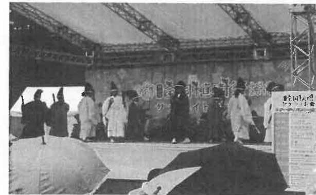
神原田神社十二神楽（大山小）