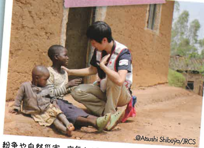
紛争や自然災害、病気などに苦しむ人びとを救うために、世界の赤十字社と連携して救援活動を行っています。