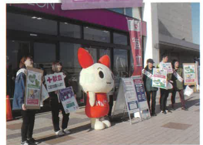
尊い生命を救うため、街頭で献血を呼びかけています。