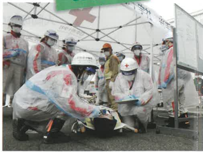
災害時には医療救護班を派遣します。日頃から訓練や研修、資機材の整備を行っています。