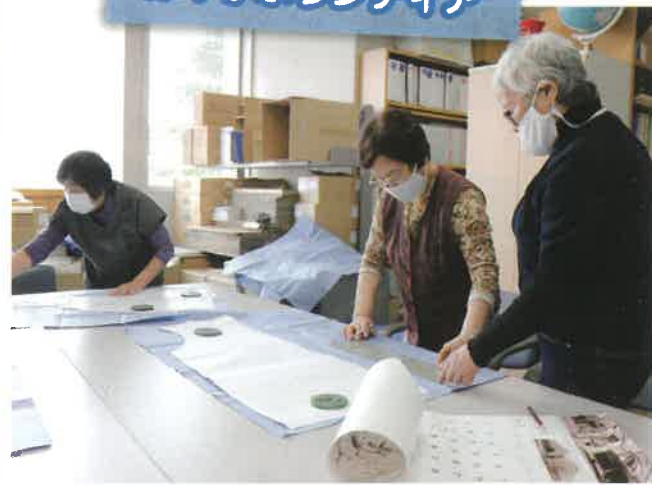
赤十字奉仕団は、赤十字思想の普及や福祉活動等、地域に根差した活動を行っています。