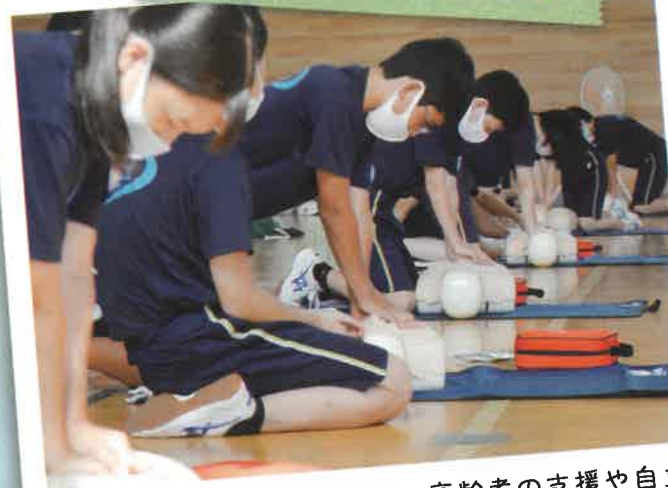
けがや急病などの応急手当、高齢者の支援や自立に役立つ介護技術などを普及しています。