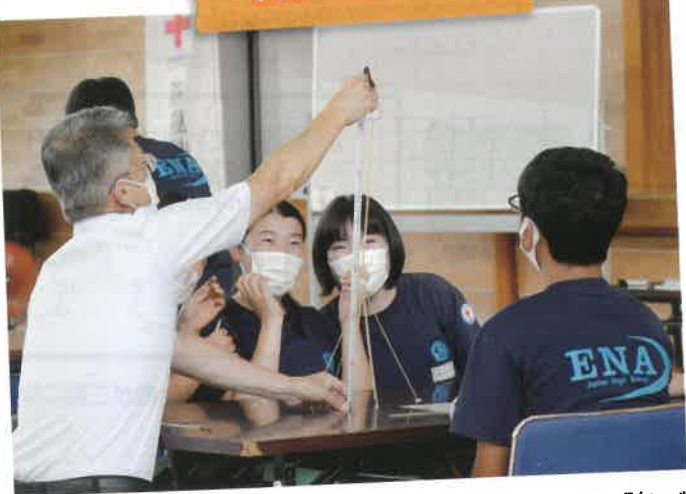
子どもたちにいのちの大切さを気づかせ、自分で「気づき、考え、実行する」主体性を育む活動を行っています。