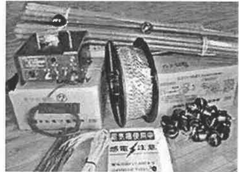
電気柵資材の提供をします