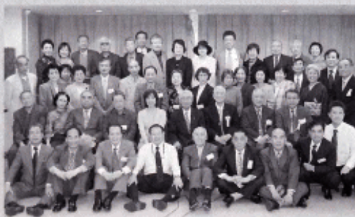
～参加者全員で記念写真～