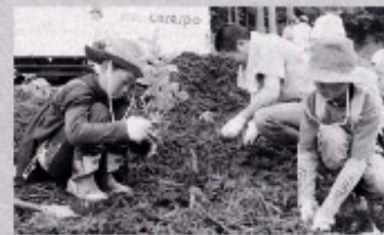
～苗木を植樹する参加者～

五月二十九日、小高倉山地区の国有林伐採跡地において環境保全活動の一環として、JR東日本主催の「安達太良ふるさと森づくり」が開催されました。このプロジェクトは、国有林伐採跡地約四・三haに三年間で二十二種類の苗木を四万五千本植樹する内容となっております。