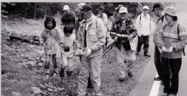
～どんな野鳥に会えるかな？～

本会では今秋にも、自然観察会を予定しております。詳細については、住民生活課生活安全係までお問合せ下さい。