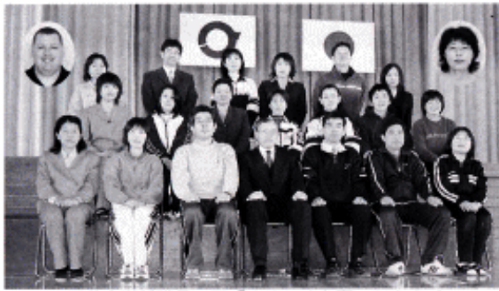
～玉井小学校職員一同「よろしくお願ひします。」～

各教科等の指導においては、算数科における複数指導体制の強化など、個に応じた指導の工夫により、子ども一人ひとりに確実に学力を身に付けるように努めます。また、自他の生命を尊重するとともに、自ら健康な身体をつくることのできる子どもを育てるため歯の働きや食に関する指導等にも力を入れます。