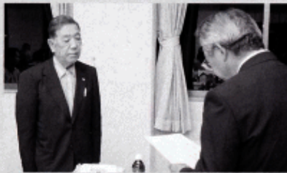
～納税貯蓄組合長の方々に委嘱状が手渡されました～