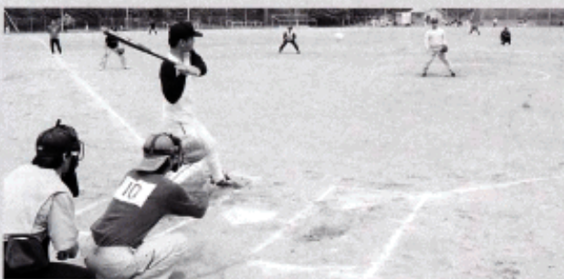
～各チームが優勝を目指しがんばりました～

五月十六日に大玉村民民運動場、大玉中学校グラウンドにおいて、三〇〇歳ソフトボール大会が行われ、村内の各地区より十七チームが参加して開催されました。当日はあいにくの天候でしたが、各選手とも白球を追い、相互の親睦を深め、応援団の熱い声援に心えながら白熱した試合を展開し、台スターズ(玉井3区)が優勝、学校組(大山3区)が準優勝しました。