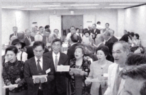
～大玉村への思いを込めて「ふるさと」を合唱～