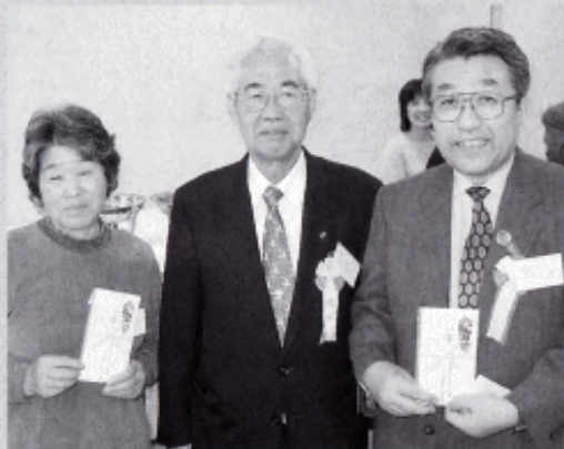
～抽選会で1等の大玉の米をゲットしたお二人～