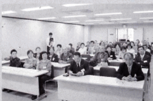
～事業計画・予算を審議～