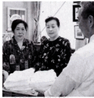
～日赤奉仕団から寄付が手渡されました～