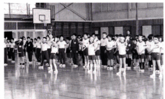
～南達小学校交歓陸上競技大会出場選手を励ます応援団～

テレビ番組等でも大玉村の自慢の第一位に挙げられた本校児童が応援団を結成し、南達小学校交歓陸上競技大会に出場する選手を励ます会を開きました。日頃、練習した成果を遺憾なく発揮し、すばらしい応援エールを演出しました。