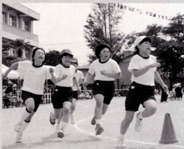
～力いっぱい走ります～

また、大勢の保護者らが詰め掛け、声援を送りながら子供達の成長をビデオやカメラに収めていました。