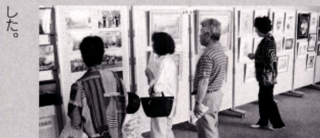
～写真展等を興味深く眺める来場者～

当日は、格安でゴルフプレイが楽しめるほか、無料で食事ができたり、大浴場が無料開放されたり多彩なイベントが行われ賑わいました。