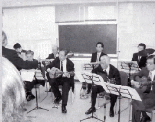
～参加者を魅了した明大マンドリンクラブOBの演奏～

今回は、都合により関東あだたら大玉の会会員からの寄稿はお休みです。四月十八日に行われました定期総会の模様を写真でご紹介いたします。