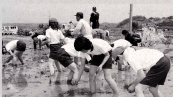
～秋の収穫を思い丁寧に植えました～

児童たちは、大玉米の生育の過程やおいしさの秘密、米づくりの苦労などを米づくりの学習を通じて学び、秋には収穫祭を予定しております。