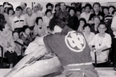
～マグロ解体実演の様子～