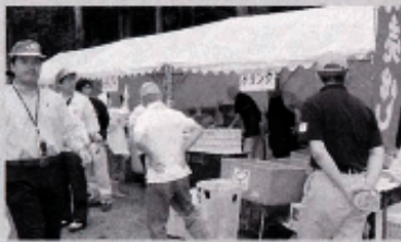
～特産品の販売等が行われました～

また、生活研究グループの方々による五月汁（豚汁）の提供や、あたららの里直売所・商工会の方々による村の特産品の販売等が行われました。