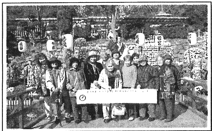
【14サロン(14区)で菊人形見学】26年11月実施