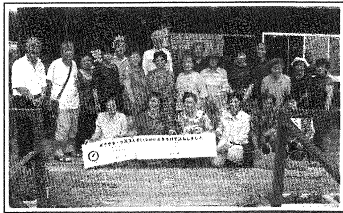
【遊遊サロン(12区)で森の民話茶屋見学】26年7月実施