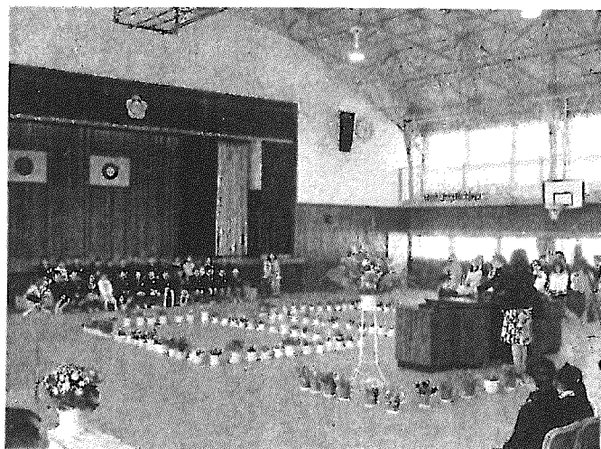
【平成26年度の入学式の様子から】

さて、学力や学習意欲を高めるために、家庭学習習慣の定着は欠かせません。地域の様々な人々との交流や体験活動は、思いやりや感謝の気持ちを育成するために、とても重要な活動です。心身ともに健康な体をつくるためには、「早寝・早起き・朝ご飯」などの望ましい生活習慣づくりがそのベースになってきます。このようにみえてくると、私たちが掲げた目標は、保護者や地域の皆様のご理解ご協力無しには達成が難しいものであることが分かります。子どもたちは、様々な「人」の影響を受け、学び、成長していきます(家庭で