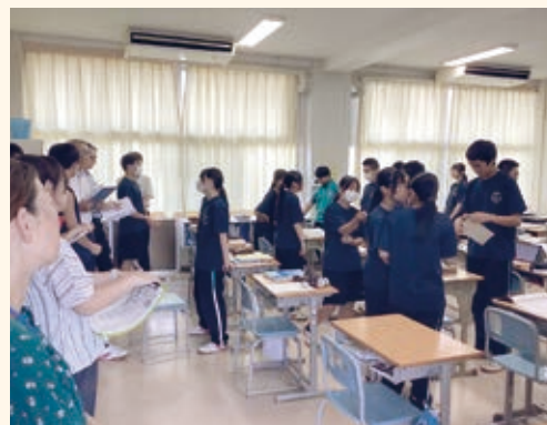
幼・小・中の先生方が集まっての授業参観