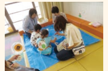
家庭教育支援 「親子ふれあい遊び～お祭り～」