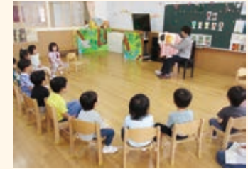
連携・協働（学校支援） 「読み聞かせボランティア」