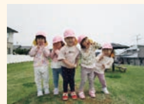
2歳児こねこ組 こども広場にて