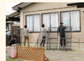
保護者参会奉仕作業