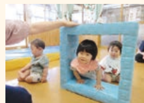
0歳児ひよこ組 室内遊び