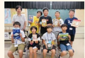
学習支援 「子ども司書養成講座 ～ミニビブリオバトル～」