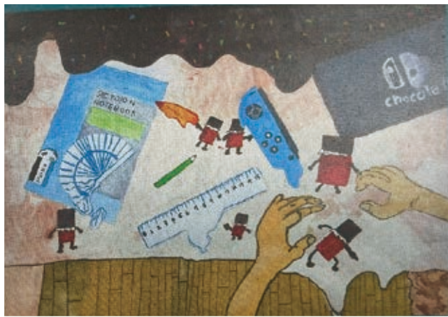
〔Chocolate town!〕 玉井小学校 松井 春輝さん