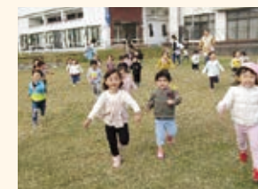
こねこ組 お散歩遠足