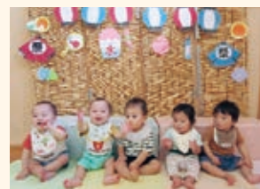
0歳児ひよこ組 夏まつり