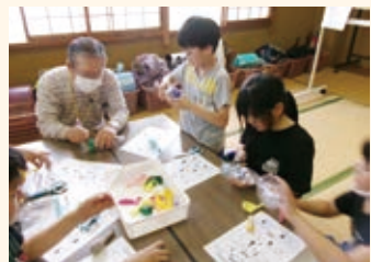
大山放課後子ども教室 「空気砲を作って遊ぼう」