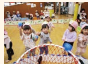
2歳児こねこ組 わんぱくデー(ミニ運動会)