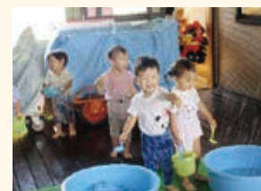
1歳児りす組 水遊び