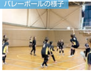
バレーボールの様子

今年はどのような大会になるのか今から楽しみです。皆様の温かい声援をお願いします。