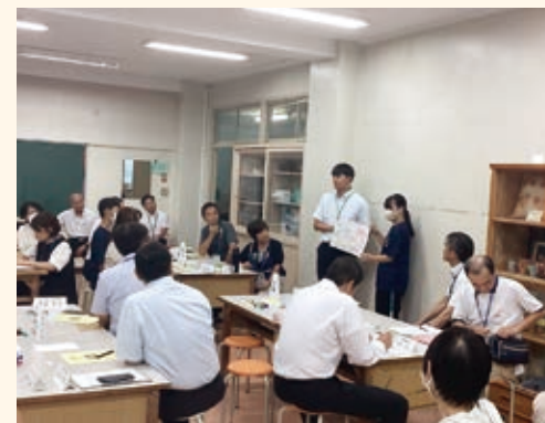
コミュニティスクール委員会の様子