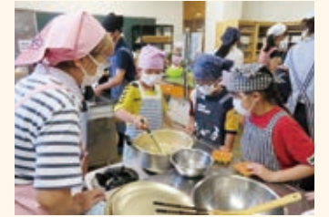
連携・協働 「わんぱく広場～カレー作り～」