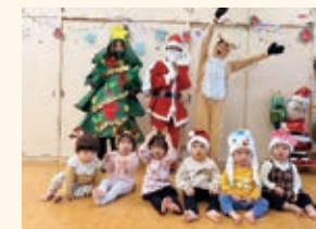
1歳児りす組 クリスマス会