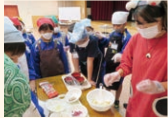
玉井放課後子ども教室 「おむすび作り」